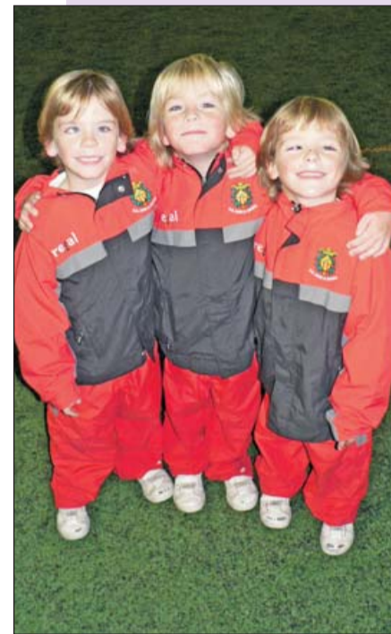
Los trillizos Arrom.

“No me gusta que los rivales nos marquen goles”